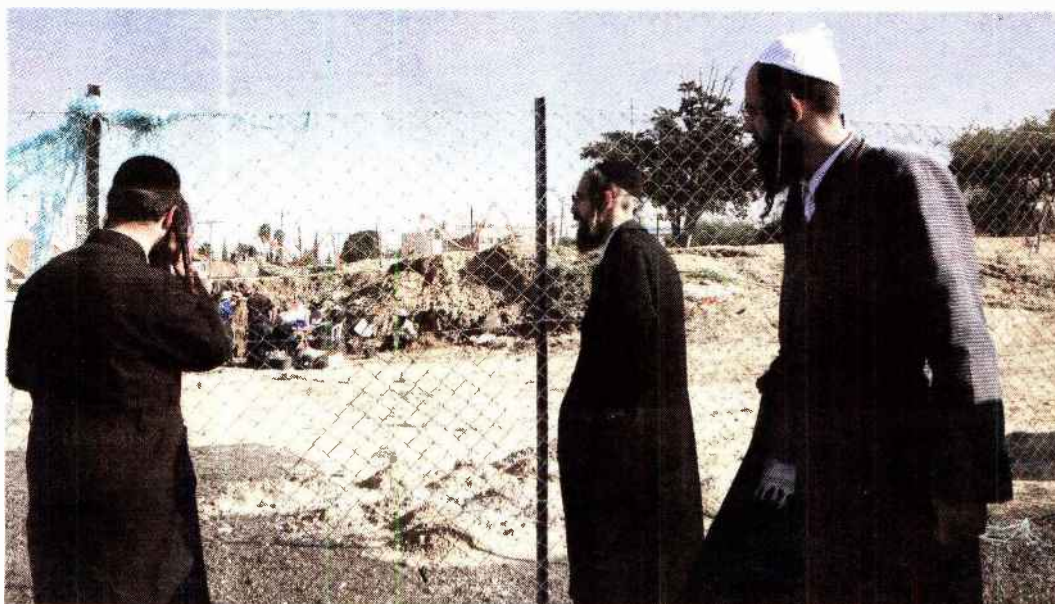
אנשי אתרא קדישא מביטים בחפירות "גם אם אין מדובר בקברים של יהודים, אסור לפגוע גם בקברים של דתות אחרות, כי הדבר נחשב לביזוי המתים"

ממצאים ארכיאולוגיים שהתגלו בחפירות ההצלה באתר המיועד לבניין העירייה החדש עלולים להצית מלחמה חדשה עם גורמים חרדיים ■ שני קברים כבר פונו מהמקום, אך באתרא קדישא משוכנעים שזה רק קצה הקרחון ■ "נותרו בשטח לא מעט עצמות", הם מזהירים ■ העירייה: "החפירות בוצעו על פי דין"